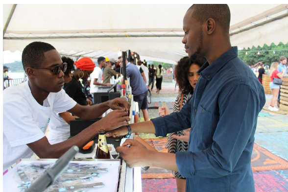
La Sunday - Abidjan