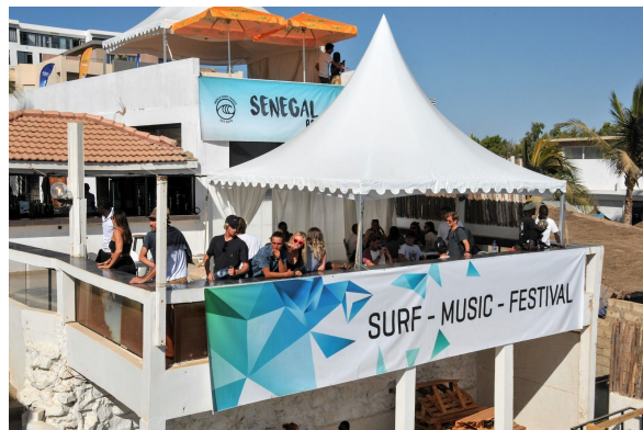
La World Surf League 2019 - Dakar